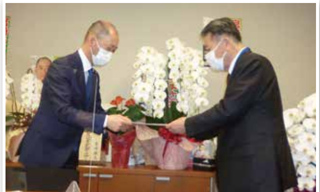
農林水産大臣政務官 宮崎雅夫参議院議員 (全国水土里ネット会長会議顧問)

その結果、支線水路などを対象に、老朽化や地震による二次災害のおそれがある施設の更新対策を実施できる事業制度の拡充が、令和4年度農林水産予算概算要求に計上されました。