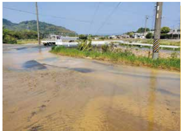
漏水で冠水した道路