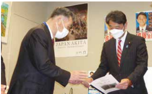
進藤金日子参議院議員 (全国水土里ネット会長会議顧問)

大規模地震の発生時、老朽化した揚水機場やファームポンドに倒壊の危険性があるとして、早期に改修・耐震対策が図れるよう「水資源機構かんがい排水事業推進協議会」や「豊川用水連絡協議会」などを通じて、関係機関に要望活動を重ねています。