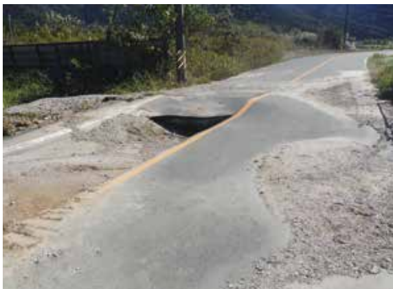
漏水で陥没した道路

地震が発生したときには、安全確保のため、豊川用水の送水を停止することがあります。ご迷惑をおかけしますが、皆さまのご理解とご協力をお願いします。