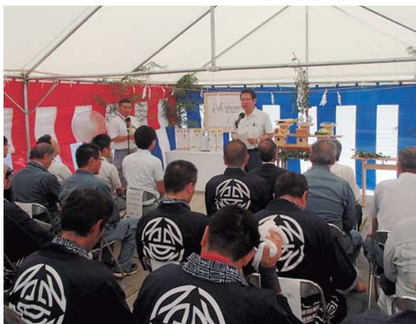
西部幹線大塚工区 (蒲郡市大塚町地内)