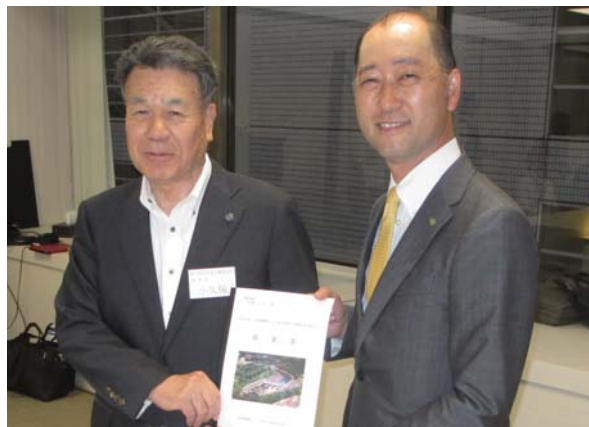
全国水土里ネット会長会議顧問 参議院議員 宮崎雅夫氏へ要望