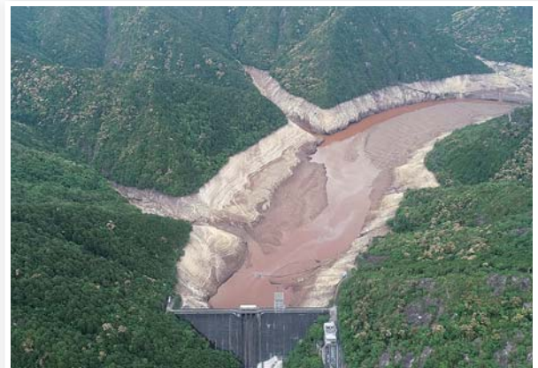
貯水量ゼロの宇連ダム