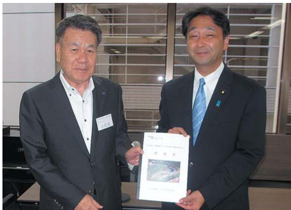
全国水土里ネット会長会議顧問 参議院議員 進藤金日子氏へ要望