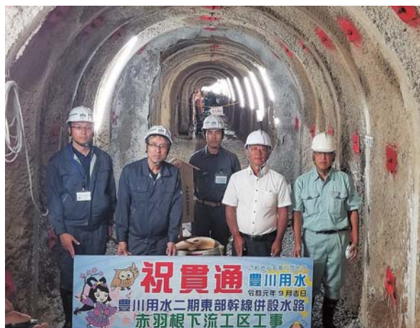
東部幹線赤羽根下流工区 (田原市赤羽根町～伊川津町地内)