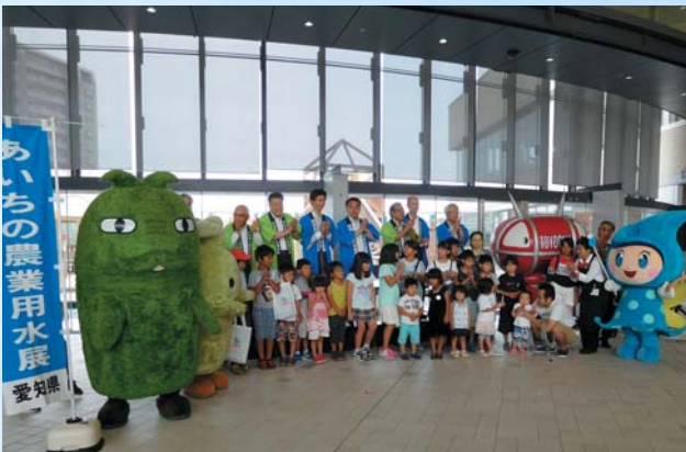
あいちの農業用水展(8月4日豊橋市こども未来館ここここ)