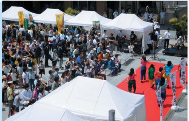
ええじゃないか豊橋まちなかマルシェ(6月3日豊橋駅南口駅前広場)