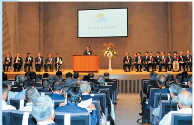
記念式典(9月29日ライブポートとよはし)