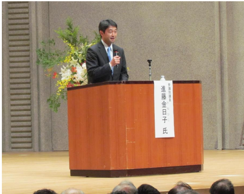
参議院議員 進藤金日子氏