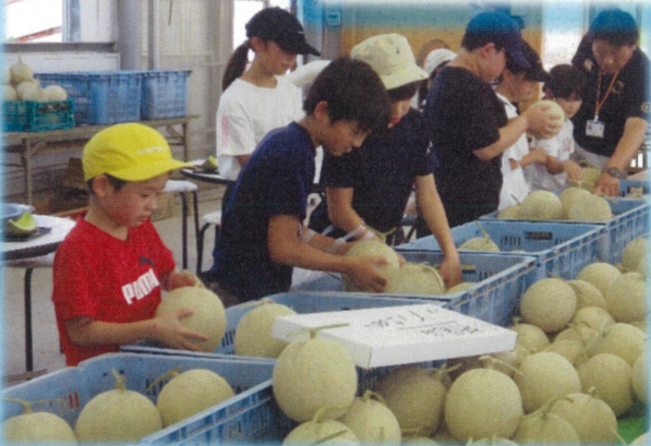
おみやげのメロン1玉ゲット！

農家さんに 『ころたんメロン』について 教えてもらったよ！ 温室内を見学したあとは、 みんなでメロンとスイカを 食べたよ！